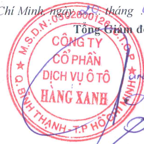
ĐỖ TIẾN DŨNG